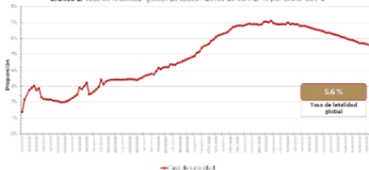
Gráfico 2. Tasa de letalidad* global de casos nuevos de COVID-19 por SARS-CoV-2